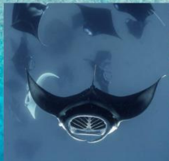
Manta Ray Snorkeling