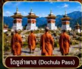
โดจุลาพาส (Dochula Pass)