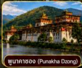
พูนาคาซอง (Punakha Dzong)