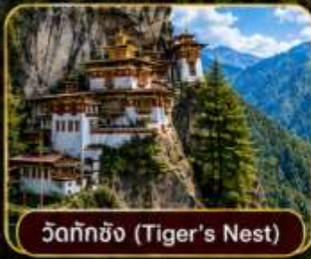
วัดทักซิง (Tiger's Nest)