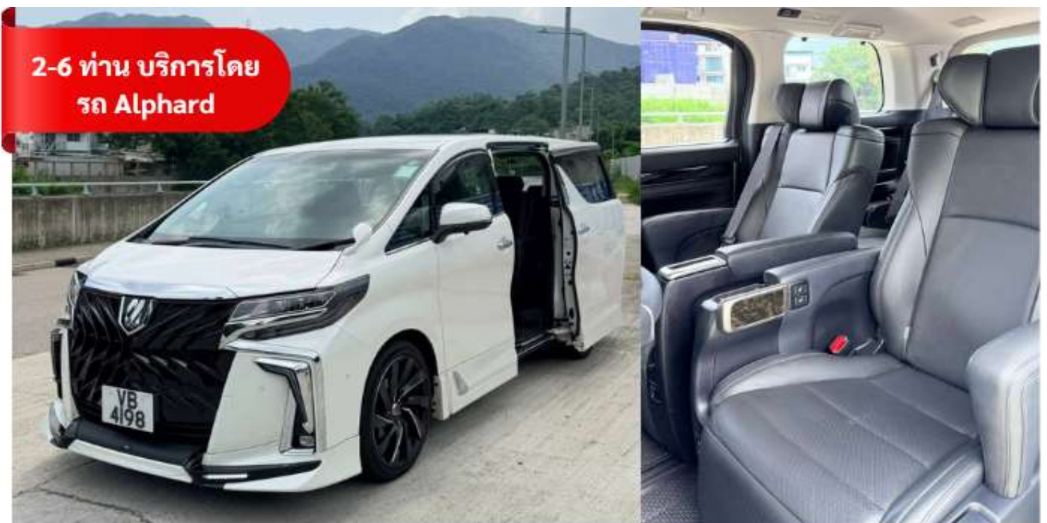
2-6 ท่าน บริการโดย รถ Alphard

** คอนเฟิร์มโรงแรม 3 วันก่อนเดินทาง ในกรณีโรงแรมที่เสนอเต็มบริษัทขอสงวนสิทธิ์ เปลี่ยนเป็นโรงแรมอื่น 3 ดาวตามมาตรฐานฮ่องกง โดยไม่ต้องแจ้งให้ทราบล่วงหน้า **