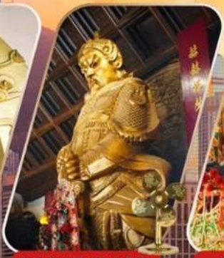
CHE KUNG (SHA TIN)