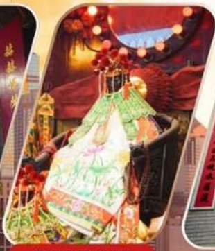
KWAN YUM HH