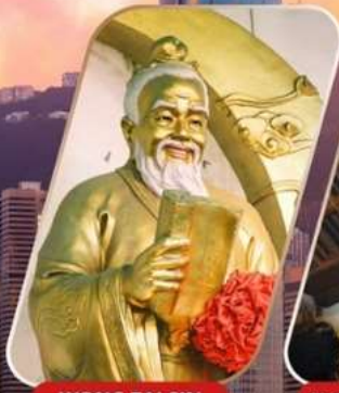
WONG TAI SIN