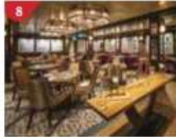
8 Bistro By Mark Best Relish contemporary Western cuisine from the internationally-acclaimed Australian chef.