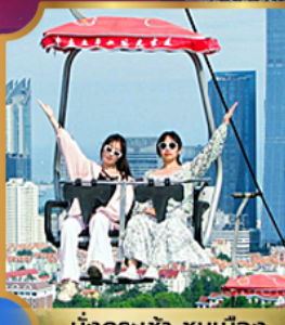
นั่งกระเช้า ชมเมือง