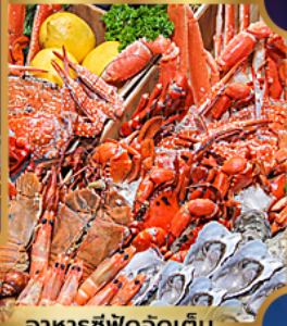
อาหารซีฟู้ดจัดเต็ม

บุฟเฟต์เบียร์ไม่อื่น + ซีฟู้ด + บิงย่างเกาหลี