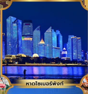
หาดโซเบอร์ฟังก์