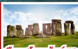
เขื่อนสโตนเฮ็นจ์ และ พิพิธภัณฑน์โรมันบาร