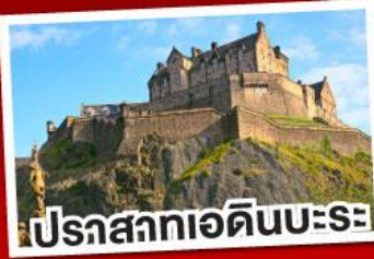
ปราสาทเอดิเนบะระ