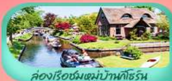
คลองเรือชมหมู่บ้านโบฮีเมีย

หนึ่งปีมีครั้ง! ชมเทศกาลดอกทิวลิป สวนเคอเคนฮอฟ Keukenhof 2026 แลนด์มาร์คโดดเด่นมหาวินาศโคโลญ สะพานไออินชอลเลิร์น ล่องเรือชมหมู่บ้านโบฮีเมีย ถึงหินลมซานส์คินส์ คลองอัมสเตอร์ดัม ตื่นตาตื่นใจกับปราสาทกราวอนสตีบ หอระฆังแห่งกนต์ บริสเซลส์ อะโดเมียม พระราชวังหลวงแห่งบริสเซลส์ เซ็คอินไฮโลท์ ประตูดัชฝรั่งเศส หอไอเฟล พิพิธภัณฑ์ลูฟร์ ล่องเรือแม่น้ำแซนสุดโรแมนติก และช้อปปิ้งจุใจที่ห้างชั้นนำ