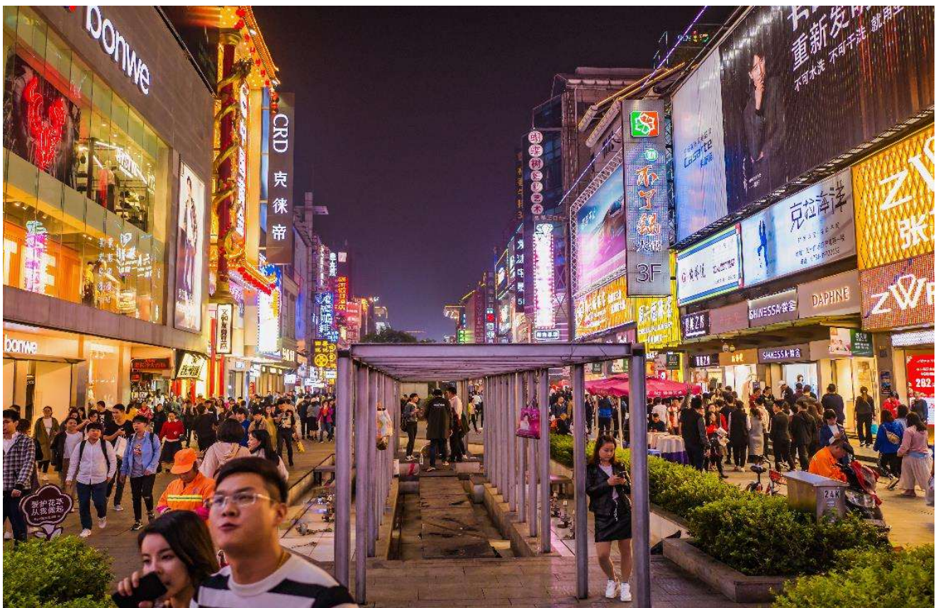
T2G-CSX16SL ZhangJiajie...ฉางซา จางเจียเจีย ฟู่หลงเจิ้น เฟิ่งหวง สะพานแก้ว 6D 5N (SL)