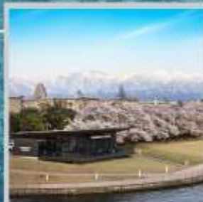
"TOYAMA KANSUI PARK"