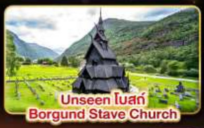
Unseen โบสถ์ Borgund Stave Church