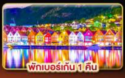
พักเบอร์เกน 1 คืน