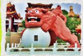
วัดเขวียนหวู