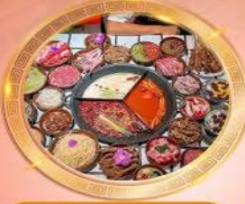
บุฟเฟต์หม้อไฟลงชิง