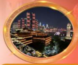
มือค้ำร้านอาหารวิวหลักล้าน