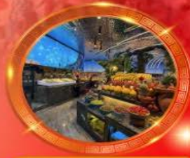
มือพิเศษ บุฟเฟต์นานาชาติ