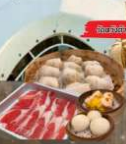
จัดของว่างแถม