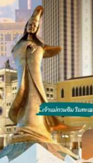
เจ้าแม่กวนอิม วิมตะเธีย