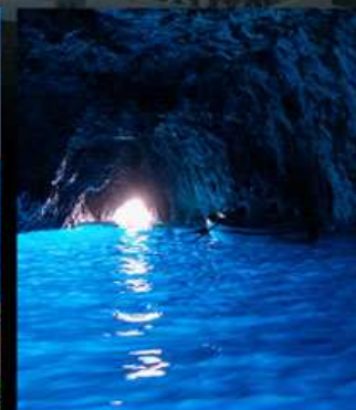
BLUE GROTTTO CAPRI