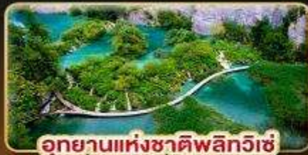
อุทยานแห่งชาติพลิตวิกิ