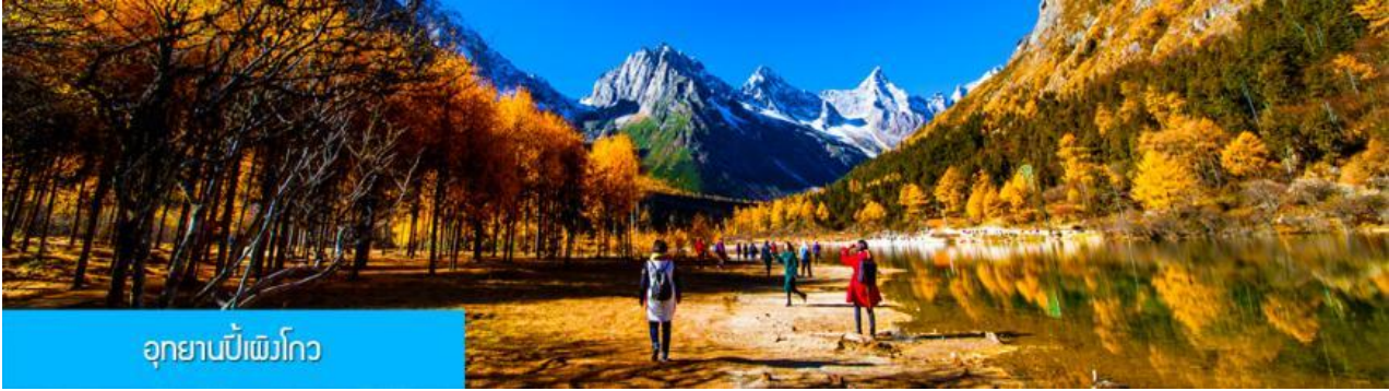
อุทยานเป่ย์ผิงโกว