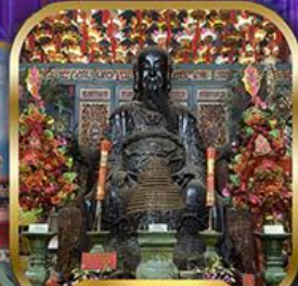
วัดบิกไต้