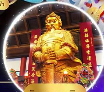
วัดแซงหมิว