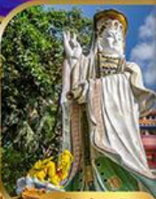
เจ้าแม่กวนอิม ริพลิสเบย์