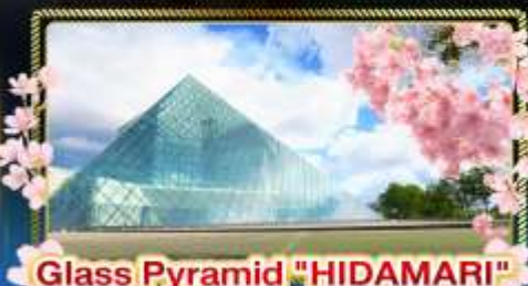
Glass Pyramid "HIDAMARI"