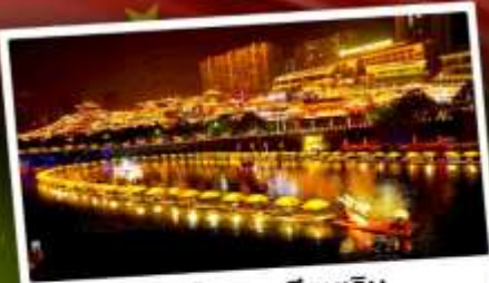
เมืองโบราณเซียนเ็น

เที่ยว 2 เมือง จางเจียเจีย & เ็นซือ ล่องเรือแคนยอนผิงซาน เทียบหุบเขาอวตาร