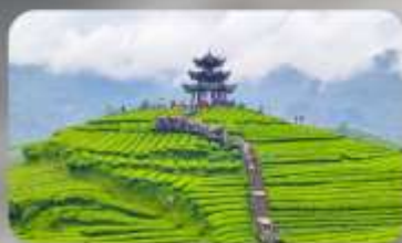
กูเขาไร่ชาอู๋เจียโก