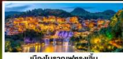
เมืองโบราณฟู่ทงเจิ้น