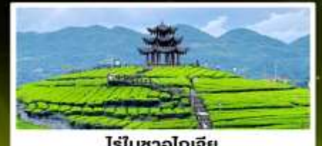
ไร่ชาอู๋โตเจีย