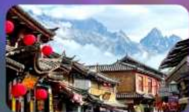
เมืองโบราณซาซี