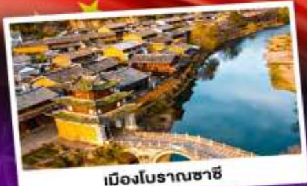
เมืองโบราณซาซี

ชมดอกไม้บานสะพรั่งทั่วยูนนาน "เซ็ดอี่แดาเพ่ว่วาสุดอี่ง"