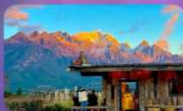
คาเฟ่ Yun Ti Yang