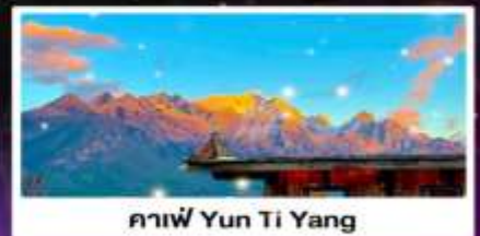
คาฟ Yun Ti Yang