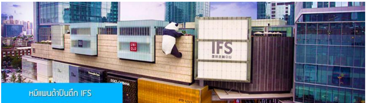
หมีแพนด้าปีนตึก IFS

เที่ยง รับประทานอาหารกลางวัน ณ ภัตตาคาร (14)