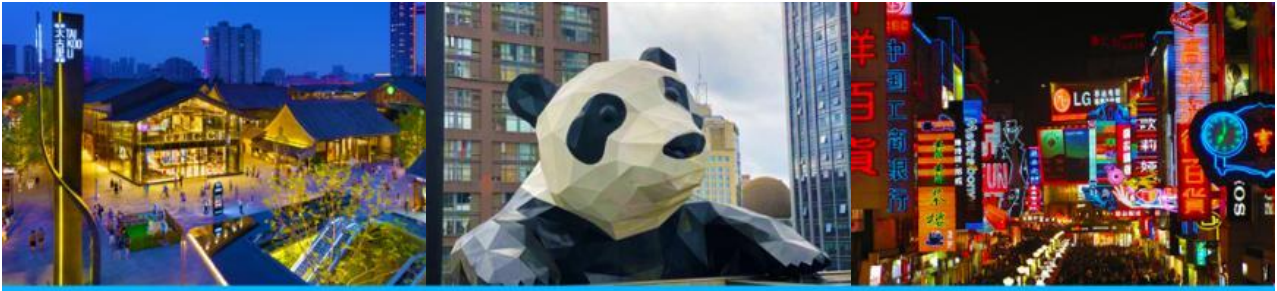
ถนนไท่กุ่หลี่ และวัดต้าจื่อ