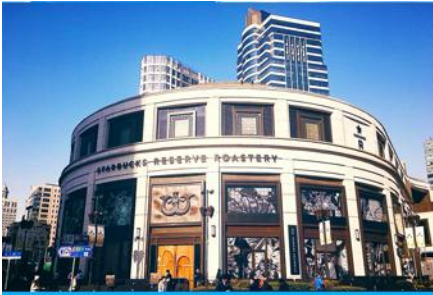
Starbucks Reserve Roastery

รับประทานอาหารกลางวัน ณ ภัตตาคาร *เมนูเดียวหลงเป่า (2)