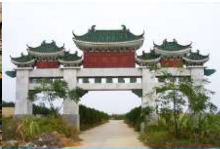
สุสานพระเจ้าตากสิน