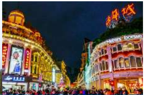
ถนนคนเดิน จวซาลู่