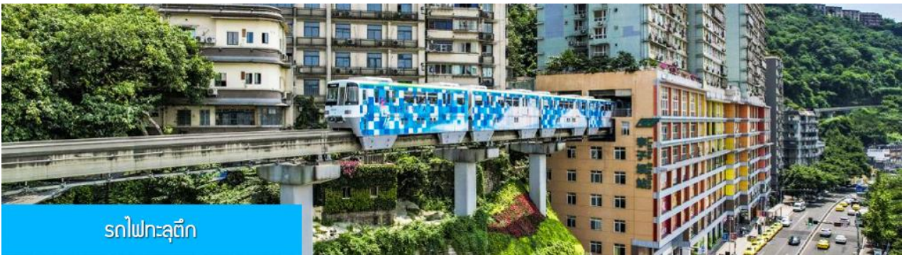
รถไฟทะลุตึก

พักที่ JINGUAN HOTEL โรงแรมระดับ 4 ดาวหรือเทียบเท่าในเมืองเฉียนเจียง