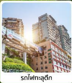
รถไฟฟ้าชุนชิ่ง