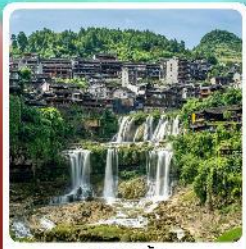
ฟูหลงเจิน