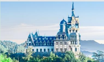
ปราสาทตามด้าว