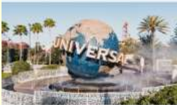
OPTION สวนสนุกยูนิเวอร์ซัล