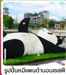
รูปปั้นหมีแพนด้าอนุเชลฟี