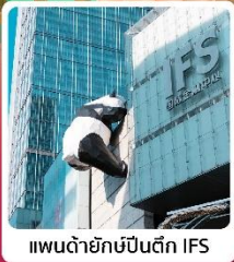
แพนด้ายักษ์ปิ่นตึก IFS