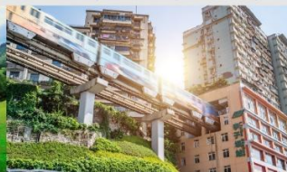
รถไฟฟ้าทะเลสาบ