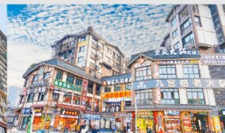
หมู่บ้านโบราณฉือซีโซ่ว

*ทางบริษัทฯ ขอสงวนสิทธิ์ในการสลับโปรแกรมทัวร์ตามความเหมาะสมขึ้นอยู่กับสถานการณ์ทำงาน โดยคำนึงถึงผลประโยชน์ของลูกค้าเป็นสำคัญ