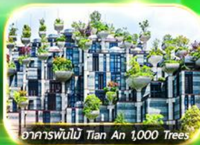
อาคารพันไม้ Tian An 1,000 Trees