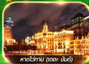
หาดไขกาน (เดอะ บันด์)

เที่ยวมหานครเซี่ยงไฮ้ ถ่ายรูปเช็คอินท์ Tian An 1000 Trees, ซินเทียนตี้ ช้อปปิ้งตลาดเงินหวงเหมียว, ถนนนานกิง