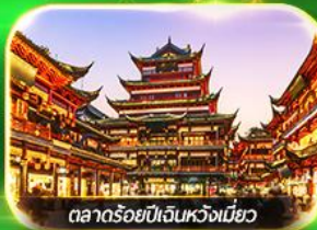
ตลาดร้อยปีเงินหวงเหมียว