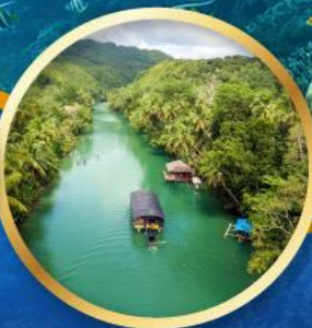
ล่องเรือแม่น้ำโลบ็อก