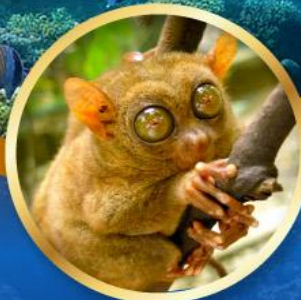
ลิงทาร์เซีย