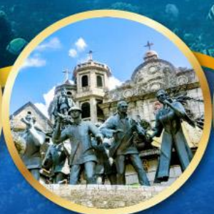
อนุสาวรีย์มรดกแห่งเซบู