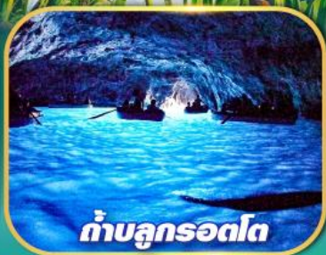
ถ้ำบลูกรอดโก