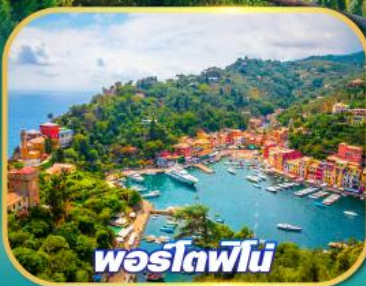
พอร์ตฟีโน