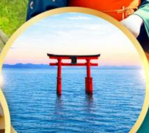
ทะเลสาบบิวะ เสาโทริอิ

เส้นทางสายอัลไพน์ทากายามา กำแพงหิมะ เพื่อนคูโรเบะ