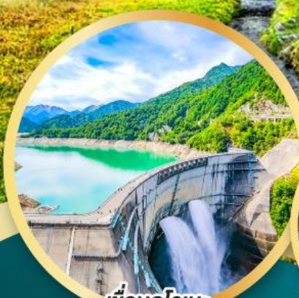
เพื่อนคูโรเบะ