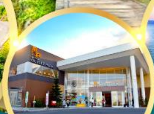
มิตรชยุ เอากะลีกพาร์ค คาโดมะ