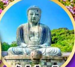
วัดโคโตคุอิน