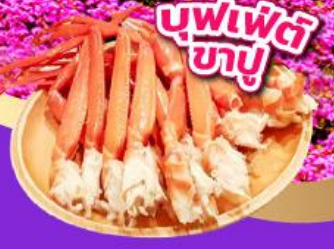
บุฟเฟ่ต์ขาปู