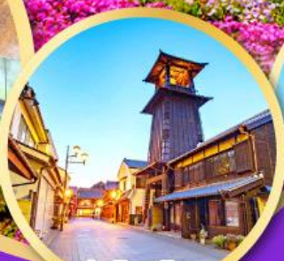
หอรบั้งโทคิโนะคามาเนะ