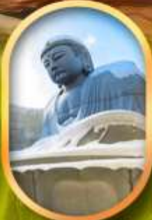
เนินเขาแห่งพระพุทธรเจ้า