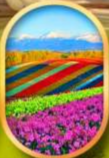
สวนดอกไม้ชิชิโซ