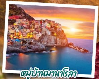
หมู่บ้านมานาโรคา