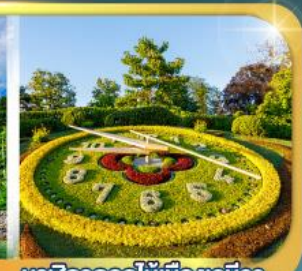
นาฬิกาดอกไม้เมืองเจนีวา