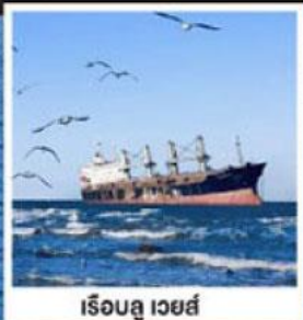
เรือลู เวย์ส์