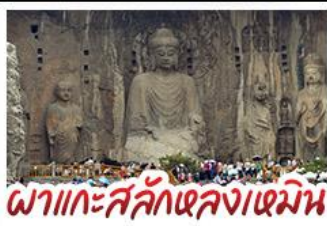
พิกัดกะสลักหลงเหมิน

เที่ยวครบ 4 มรดกโลก ถ้ำหลงเหมิน - สุสานจิ๋นซีฮ่องเต้ - วัดเส้าหลิน หมู่บ้านไต้คินसानโจว - หมู่บ้านกัวเลียงซุน