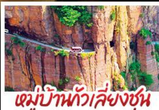
หมู่บ้านกัวเลียงซุน