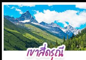
เขาสี่ดรุณี