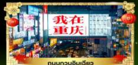
ถนนทวงจิมเฉียว