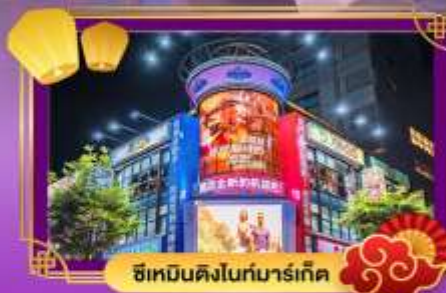
ซีเหมินดิงไนท์มาร์เก็ต