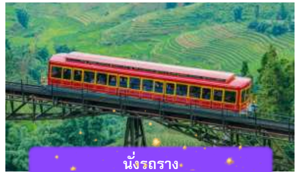
นั่งรถราง

เที่ยง บริการอาหารกลางวัน ณ ภัตตาคาร พิเศษ ... เมนูบุฟเฟต์ฟานซีปัน