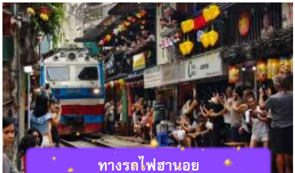
ทางรถไฟฮานอย

เช้า บริการอาหารเช้า ณ ห้องอาหารของโรงแรม หลังจากนั้นนำท่านเดินทางสู่ ทางรถไฟฮานอย เป็นแหล่งท่องเที่ยวที่ได้รับความนิยมในกรุงฮานอย ประเทศเวียดนาม. จุดเด่นของที่นี่คือทางรถไฟที่วิ่งผ่านย่านชุมชนที่อยู่อาศัย ทำให้เกิดภาพวิถีชีวิตที่แปลกตาและเป็นเอกลักษณ์ ท่านสามารถทดลองชิมกาแฟแท้ๆจากเวียดนามได้ที่นี้ อาทิ กาแฟนมเวียดนามที่มีความเข้มข้น กาแฟไข่นุ่มนวลหอมละมุน หรือกาแฟเกลือที่ทำให้ความรู้สึกแปลกแต่อร่อยอย่างบอกไม่ถูก ( ไม่รวมค่าเครื่องดื่ม )