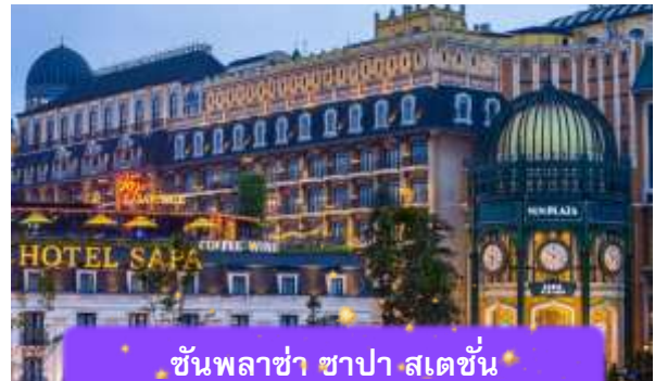
ชั้นพลาซ่า ซาปา สเตชั่น