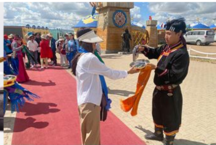
พิธีต้อนรับแขกด้วยเหล้า