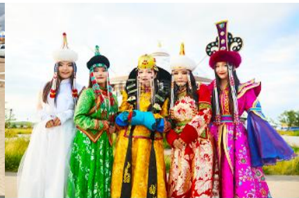
แต่งชุดพื้นเมืองบอโกล