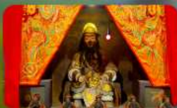
องค์เขกงเก่า 600 ปี