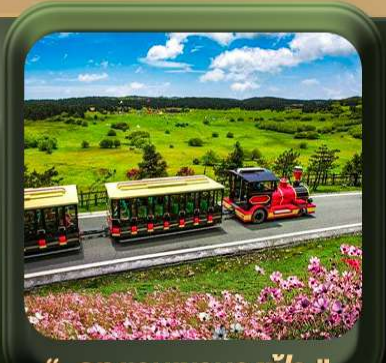
“ อุทยานเขานางฟ้า ”

T2G-CKG26CZ Special of Chongqing...จงซิ่ง ต้าจู้ อุ้หลง อุทยานหลุมฟ้า เขานางฟ้า 5D 3N (CZ)