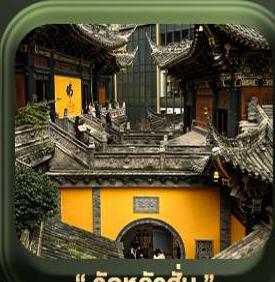
“ วัดหลิวอัน ”