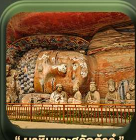
“ ผาหินแกะสลักต้าจู้ ”