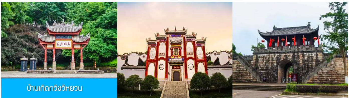
บ้านเกิดกวีวีหยวน

พักที่ HONG QIAO HOTEL โรงแรมระดับ 4 ดาวหรือเทียบเท่าในเมืองหยีซัง