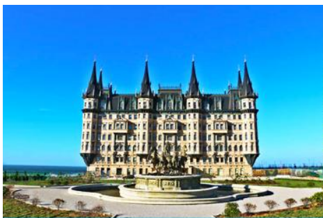
คฤหาสน์เหวินเจิง

นำท่านไปเยือนเมืองท่าสุดโรแมนติคสไตล์ยุโรป ท่าเรือชาวประมง ให้ท่านได้ชมสถาปัตยกรรมสไตล์อเมริกาเหนือ และ ยุโรป ที่ตั้งอยู่ในผืนแผ่นดินจีน ณ เมืองเยียนไถ เก็บบรรยากาศลมทะเล และเก็บรูปกับอาคารหลังคาสี่สไลเป็นฉากหลัง ที่เต็มไปด้วยมนต์เสน่ห์และความทรงจำที่สวยงาม ให้ท่านเก็บภาพความสวย