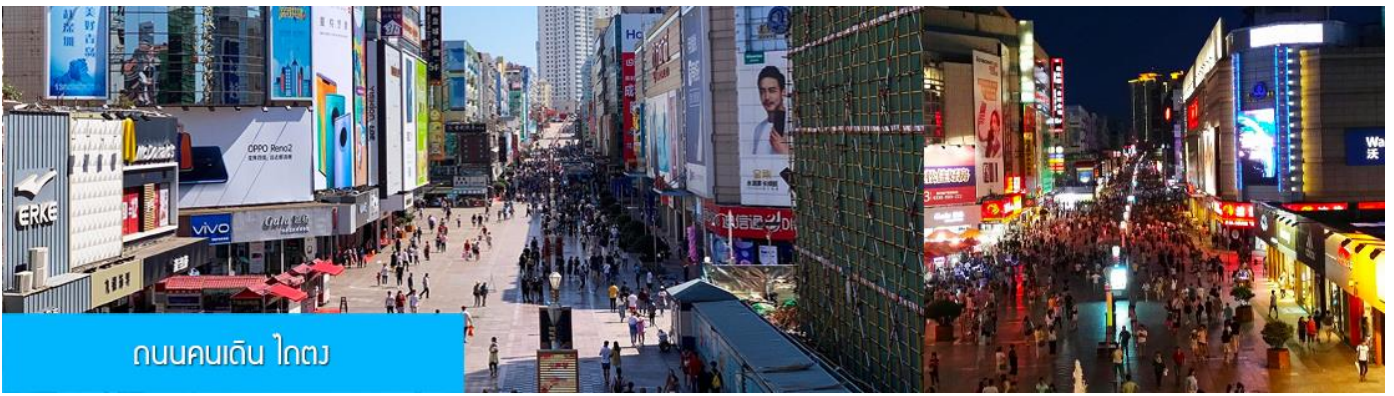
ถนนคนเดิน ไตตง

จากนั้นนำท่าน สู่ ถนนคนเดิน ไตตง 台东步行街 ย่านการค้าเป็นถนนคนเดินที่ใหญ่และคึกคักของเมืองชิงเต่า ที่นี้เป็นแหล่งรวมร้านค้าสินค้าแฟชั่นร่วมสมัย สินค้าพื้นเมือง ของที่ระลึก และร้านอาหาร บาร์เบียร์ของเมืองชิงเต่ามากมาย, ให้ท่านมีเวลาอิสระเดินเล่น ช้อปปิ้ง ลิ้มรสอาหารพื้นเมือง และเลือกซื้อของฝาก ตามอัธยาศัย