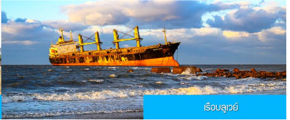
เรือบลูเวย์