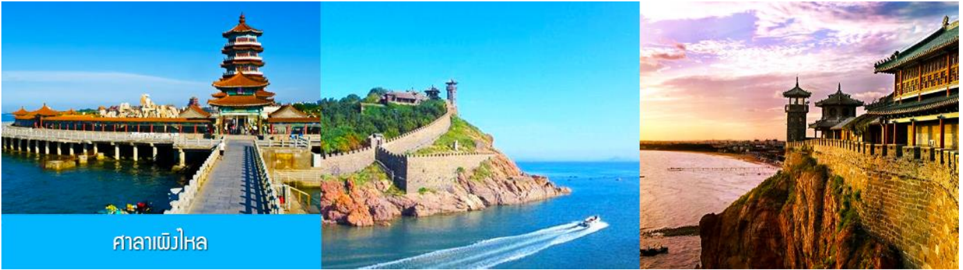
ศาลาเพิงไห่

หรูหรา และได้สัมผัสกับสถาปัตยกรรมสไตล์บารอกที่ยิ่งใหญ่ เหมือน หลุดเข้าไปในเทพนิยายของยุโรป ให้ท่านเก็บภาพบรรยากาศตามอรัยาศัย จนได้เวลาอันสมควร นำท่านเดินทางสู่ภัตตาคาร