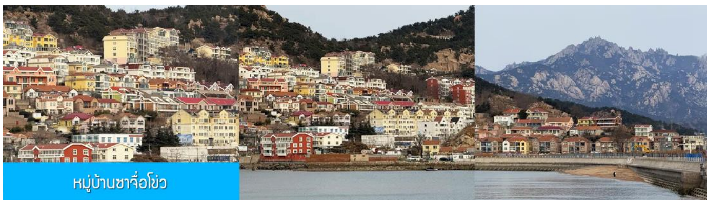
หมู่บ้านซาจื่อโข่ว

เที่ยง รับประทานอาหารกลางวัน ณ ภัตตาคาร (มื้อที่ 7)