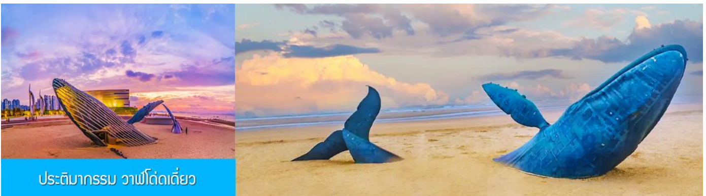
ประติมากรรม วาฬโดดเดี้ยว

นำท่านชมซุ้มประตูเพิงไห่ พระราชวังมังกร พระราชวังราชินีแห่งสวรรค์ และศาลาหลัก ชมทัศนียภาพอันตระการตาของเขตแดนทะเลเหลือง-ทะเลป้อไห่ ชม "ศาลาอมตะทะยานสู่ท้องฟ้า" จากนั้นนำท่านเดินทางไป ยังจุดชมวิวแปดเซียนข้ามทะเล ชมสถานที่สำคัญอันเป็นสัญลักษณ์ เช่น หอคอยเซียนหยวน กำแพงแปดเซียน และศาลาซู่เซียน โครงสร้างรูปทรงน้ำเต้าที่ล้อมรอบด้วยทะเลทั้งสามด้าน เชื่อมโยงตำนานแปดเซียนเข้ากับ ความมหัศจรรย์ของภาพลวงตา