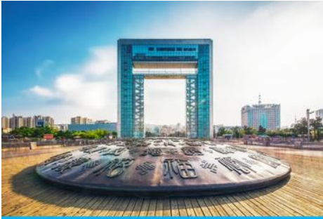
ประตูแห่งโซค

ครบรอบ 100 ปี ของการเปิดท่าเรือเวย์ไห่ จึงขนานนามว่าเป็น ประตูแห่งโซคลาก ที่คอยต้อนรับนักท่องเที่ยวทุกท่าน โครงสร้างของประตูที่ตั้งตระหง่าน โอบล้อมของท้องทะเลและเกาะหลิวกง อยู่เบื้องหน้า เป็นภาพที่สวยงาม ให้ท่านเก็บบรรยากาศเป็นที่ระลึก จากนั้นเดินทางสู่ภัตตาคาร