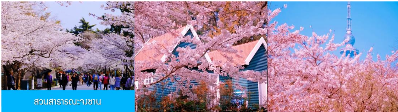
สวนสาธารณะจางซา

ยุโรปในแผ่นดินจีน และเมืองที่มีวัฒนธรรมที่ผสมผสานทิวทัศน์ชายทะเลที่สวยงาม มีมนต์เสน่ห์อันเป็นเอกลักษณ์เฉพาะตัว (ใช้เวลาเดินทางประมาณ 3 ชั่วโมง)