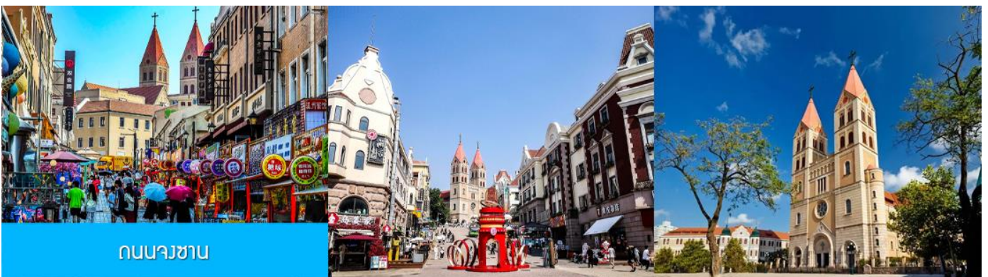
ถนนนางซาน

หลังอาหารนำท่านเดินทางชม สะพานจ้านเจียว เป็นแลนด์มาร์กประวัติศาสตร์คู่เมืองชิงเต่า สร้างเมื่อปี ค.ศ. 1891 มีลักษณะเป็นสะพานหินทอดยาวกว่า 440 เมตรสู่ทะเล ปลายสะพานมีศาลา ทรงแปดเหลี่ยมสีแดงที่โดดเด่น ซึ่งเป็นสัญลักษณ์บนฉลากเบียร์ชิงเต่า ขึ้นชื่อเรื่องวิวสวย รับลมทะเล ให้ท่านเก็บภาพบรรยากาศ จากนั้นนำท่านเดินเที่ยวชม ถนนจงซาน 中山路 ถนนที่เต็มไปด้วยกลิ่นอายยุโรป และถนนสายนี้มีบันทึกเรื่องราวมากกว่าศตวรรษของเมืองชิงเต่าไว้ ที่นี่เป็นศูนย์กลางการค้าแห่งแรกที่เต็มไปด้วยสถาปัตยกรรมสไตล์ยุโรปเก่าแก่ที่ได้รับอิทธิพลมาจากเยอรมัน ให้ท่านได้เดินเก็บบรรยากาศ และ เก็บภาพกับ โบสถ์เซนต์ไมเคิล (ด้านนอก) โบสถ์แห่งนี้ที่คู่รักนิยมมาถ่ายภาพงานแต่งงานกันมากที่สุดในเมืองชิงเต่า ให้ท่านถ่ายรูปเก็บภาพ จากนั้นเดินทางต่อ สู่ย่าน เมืองเก่าเยอรมัน ตรอกกว้างชิงหลี่ 广兴里 ตรอกชอกชอยที่เรียงรายไปด้วยอาคารสถาปัตยกรรมแบบ ผสมผสานจีนและอาคารสไตล์ยุโรป