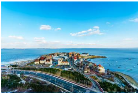
ท่าเรือชาวประมง

08.05 น. ถึงสนามบินเมืองเยียนไถ (เวลาที่ท้องถิ่นเร็วกว่าไทย 1 ชั่วโมง) นำท่านผ่านการตรวจตราเอกสารและรับสัมภาระเรียบร้อย นำท่านเดินทางโดยรถบัสปรับอากาศ เดินทางสู่เมืองเยียนไถ