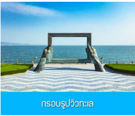
กรอบรูปวิวทะเล