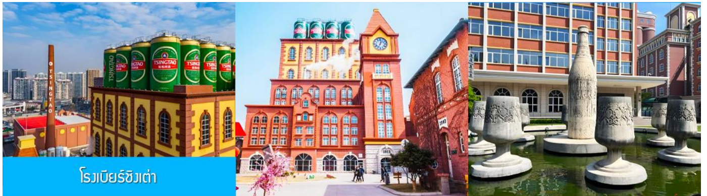
โรงเบียร์ชิงเต่า

จากนั้นนำท่านเที่ยวชม โรงเบียร์ชิงเต่า 青岛啤酒博物馆 พิพิธภัณฑ์เบียร์ที่ขึ้นชื่อของเมืองชิงเต่า ซึ่งเป็นเบียร์ยี่ห้อแรกที่ผลิตขึ้นในประเทศจีน ชมเบียร์ คอลเลกชันที่มียี่ห้อหลากหลายที่สุดของโลก และชมการจัดแสดงภาพและวิทัศน์เกี่ยวกับวิวัฒนาการของเบียร์ ขั้นตอนการผลิตและอื่น ๆ ที่เกี่ยวข้อง พร้อมชมเบียร์ชิงเต่า ซึ่งเป็นเบียร์ที่ขายดีที่สุดยี่ห้อหนึ่งของจีน.. (ชมเบียร์ชิงเต่าท่านละ 1 แก้ว รับกลับอีก 1 ขวดเล็ก ตอนเดินออก)