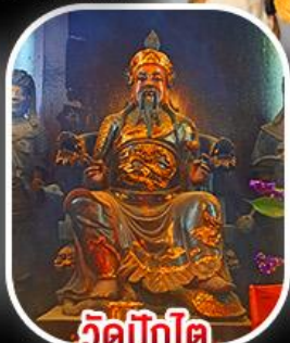
วัดบิกิต