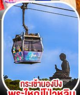
กระเช้าเองปัง พระใหญ่ไผ่หลิน